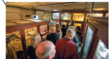
Blick in die „Alte Erdbebenwarte“ an einem Besuchertag.

Wiechert'sche Erdbebenwarte Göttingen Herzberger Landstraße 180 / 182 · 37075 Göttingen