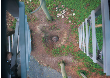
Fallturm der Mintrop-Kugel – Blick aus 14 Metern Höhe.