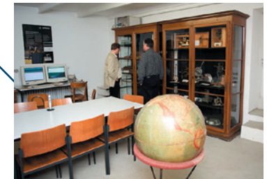
Blick in die „Neue Erdbebenwarte“.