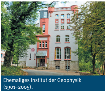
Ehemaliges Institut der Geophysik (1901–2005).