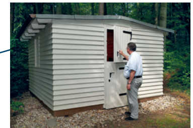
Die Astronomische Hütte.