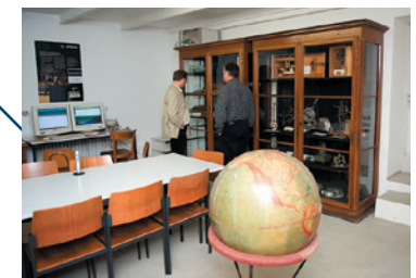
Blick in die „Neue Erdbebenwarte“.