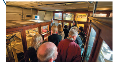
Blick in die „Alte Erdbebenwarte“ an einem Besuchertag.

Wiechert'sche Erdbebenwarte Göttingen Herzberger Landstraße 180 / 182 · 37075 Göttingen